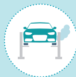
Émissions de moteur Diesel