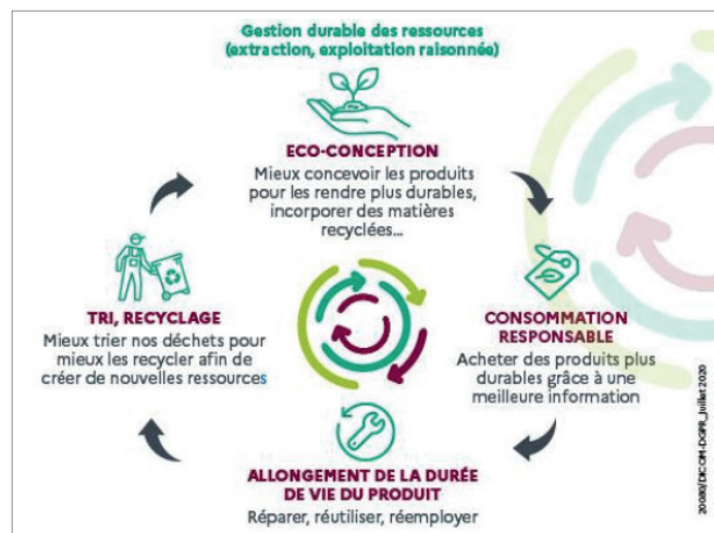
Modèle de l'économie circulaire

Elle vise à augmenter l'efficacité de l'utilisation des ressources et à diminuer l'impact sur l'environnement.